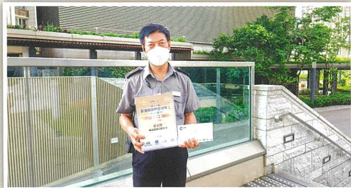
葉家照 - 海之戀